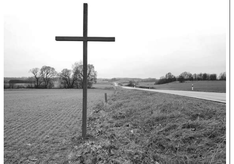
Neatmestina, kad šalia žemdirbių žaliųjų kryžių ilgainiui pradės kilti ir verslininkų kryžiai.

„Kai įstatymo iniciatoriai viešai pripažįsta nesuprantantys, ką siūlo apmokestinti, nes neskiria bankų aktyvų nuo pasyvų, tokio finansinio neraštingumo pasekmės gali būti labai liūdnos visiems šalies žmonėms. Nes iš tikrųjų siūloma apmokestinti paskolas žmonėms ir verslui. O tai reiškia, kad mažiau šeimų galės pasinaudoti paskolomis būstui įsigyti ar verslui plėtoti, nes valdantieji padidins paskolų palūkanas. Tą rodo ne tik mūsų skaičiavimai – turime aiškų atsakymą iš Lenkijos: paskolų ten jau išduodama mažiau, palūkanos kyla, užsienio kapitalo bankai