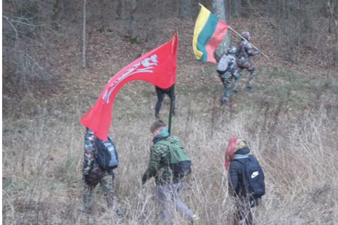
„Mažoji gvardija“ žengia per šilus, kalvas ir slėnius...

Mažoji jaunųjų šaulių ir piliečių gvardija įveikė beveik septyniolikos kilometrų istorinės atminties kelią, taip svarbias sukaktis paminėjusi bei kovotojus už laisvę pagerbusi.