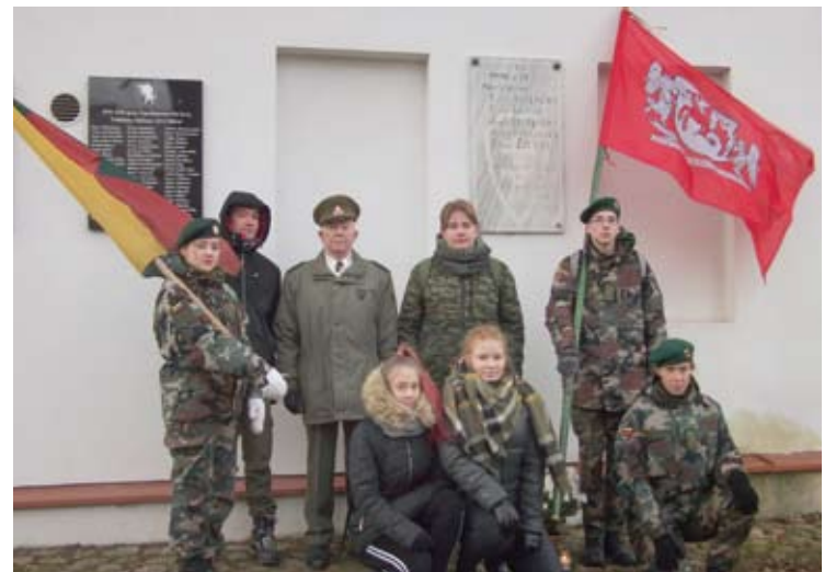
Mąslī tyla šaulių žūties vietoje Troškūnuose.

klausę, veikai paminklą karaliui Mindaugui didžiojoje Latvijos pakrančių kryžkelėje pasiekėme. Čia vėl buvo ką prisiminti: karalystė, vienintelis karalius Mindaugas, jo karūnavimo iškilmės, iš Rygos atkeliavusio ir karūnas valdovui bei jo žmonai Mortai atgabenusio Livonijos magistro Andriaus Štirlando istorija. Jaukiame Šilo prieglobstyje greitu žingsniu į garsųjį Palatavio piliakalnį kopėme, per kalvas ir slėnius vingiuojančiu