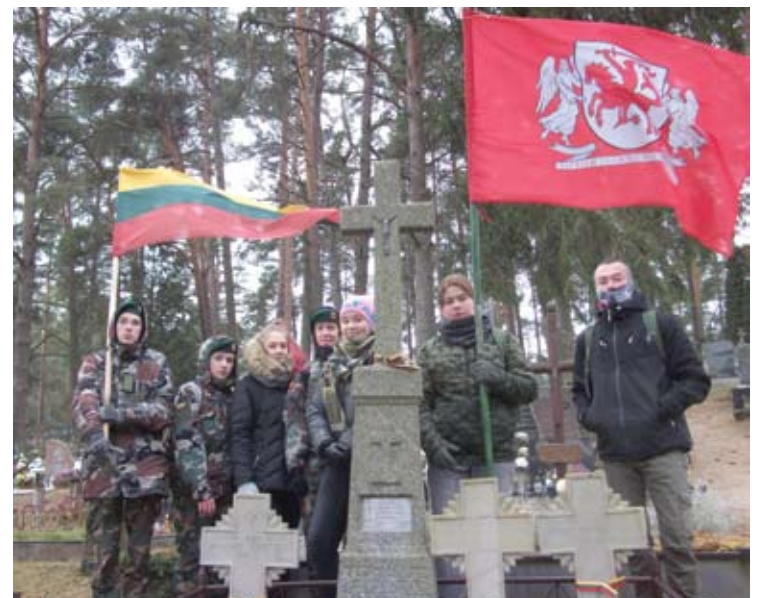
Stabtelėjimas Andrioniškio kapinėse: čia palaidoti trys 1920 m. Troškūnuose žuvę šauliai.